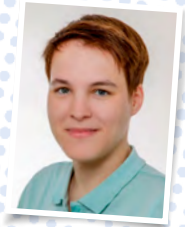
Virginia Rosenberg Ballsport, Pferdefreizeit, Ferienspiele